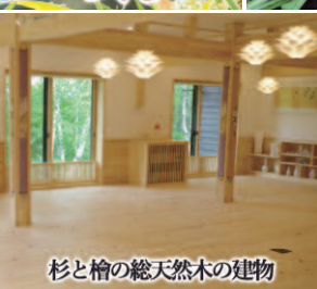
杉と檜の総天然木の建物