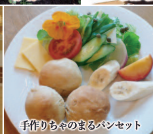
手作りちやのまるパンセット