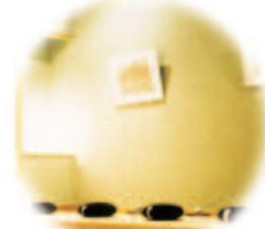
いのちの森坐禅堂