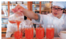
無農薬人参ジュース

2日目 7:00～自然農園散策 7:30～朝食 9:00～講義・Q & A 12:00～感想文記入 12:30～昼食(希望者のみ) 13:30～乗合タクシー発