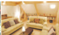
ゆっくりとくつろげる