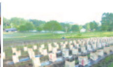
作物の養生 あんどん