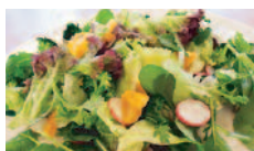
お野菜たっぷりサラダ