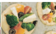
絶品!! フォカッチャ