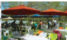
白樺林の中のランチ