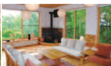
緑っぱいのホール