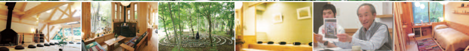
豊富な経験から来る細金先生のわかりやすい講座は、実践を交えながら、質問が飛び交いながら、お互いに共振し合う事を大切にしていけます