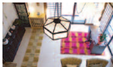
しゅり庵のリビング