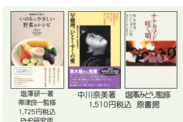
塩澤研一著 帯津良一監修 1,725円税込 P-H研究所 中川奈美著 1,510円税込 原書房 塩澤みどり監修