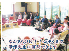
なんでもOK!!心ゆくまで帯津先生に質問できます