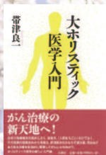
帯津良一著 春秋社