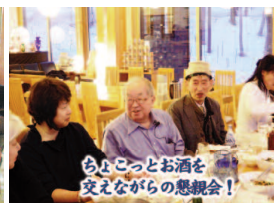
ちよこっとお酒を交えながらの懇親会!