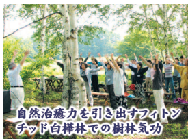
自然治癒力を引き出すフィットネス チット白樺林での樹林気功