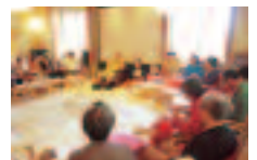
何でもご質問下さい