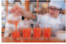
名物にんじんジュース