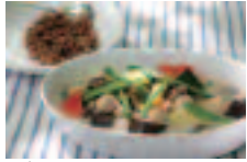
グリーンカレーと酵素玄米