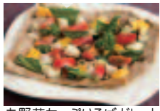
お野菜たっぷりそばガレット