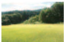
お米も無農薬で育てます