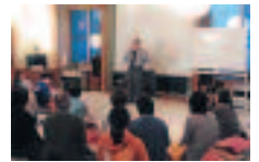
わかりやすい講義