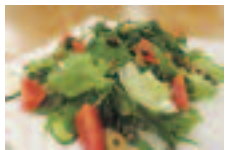
朝採り一番新鮮サラダ