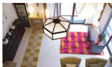
しゅり庵のリビング