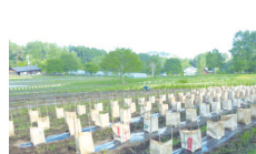
作物の養生 あんどん