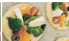
絶品!! フォカッチャ