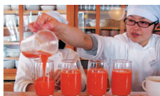
無農薬人参ジュース

2日目 7:00～自然農園散策 8:00～座禅 9:00～朝食 10:00～講義・Q & A 12:30～感想文記入 13:00～終了