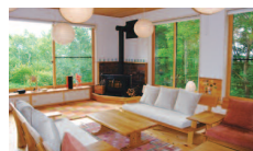
緑いっぱいホール