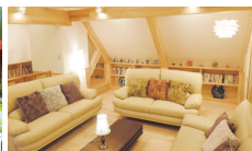
ゆっくりとくつろげる