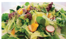
お野菜たっぷりサラダ