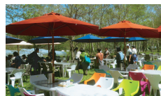
白樺林の中のランチ