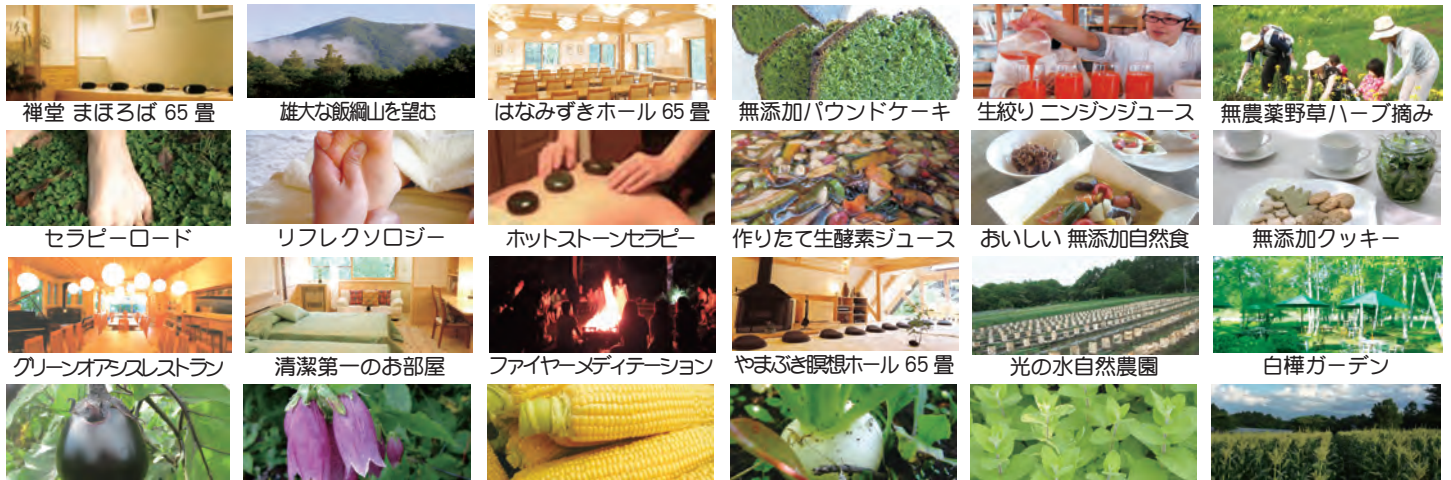
隣接した自然農園では農薬も化学肥料も一切使わないでお野菜を育てています。畑にはさまざまなお野菜、野草、虫などが共生しています。

いのちの森の大自然のエネルギーは、心と体を癒し、自然治癒力を高めます。隣接する水輪ナチュラルファーム自然農園では農薬や化学肥料を一切使用せずお野菜を作り、環境と健康に配慮した農法を行っています。大切に保護された自然は、やどりぎや銀竜草など高山植物、また山野草の宝庫です。館内寝具類は清潔を保ち、施設には和紙の照明、建物は天然木の檜や杉材を使用することで、人工的な建材によって遮断されることなく大自然のもつ澄んだ空気を、存分に味わうことができます。厳選された無添加の食材・調味料、無農薬野菜などを使った心のこもった美味しい食事は心身をリフレッシュしてくれます。