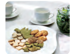
手作り野草クッキー