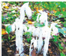
綺麗な所にしか生えない銀龍草