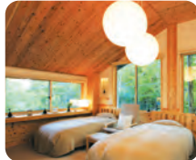
清潔第一のお部屋