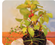
館内を彩るこけ玉