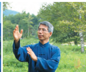
大自然の中で深まる気

主催・申込み・問い合わせ 公益財団法人いのちの森文化財団 会場 信州飯綱高原 いのちの森・心と体といのちのセンター「水輪」 〒380-0888 長野県長野市飯綱高原2471-2198 TEL 026-239-0010 FAX 026-239-0011 e-mail: zaidan@inochinomori.or.jp URL http://inochinomori.or.jp