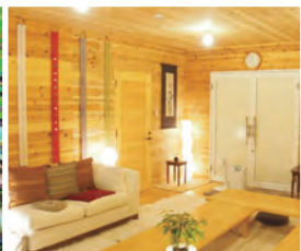
清潔な館内でおくつろぎ下さい