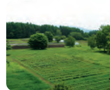
隣接する5町歩の畑