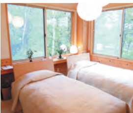
窓からは緑あふれる景色が