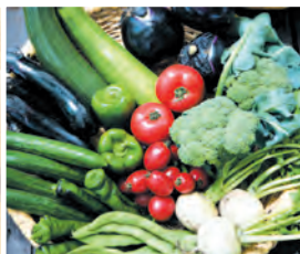
自然農園の朝採り野菜を使った食事