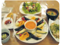
全て手作りのお料理