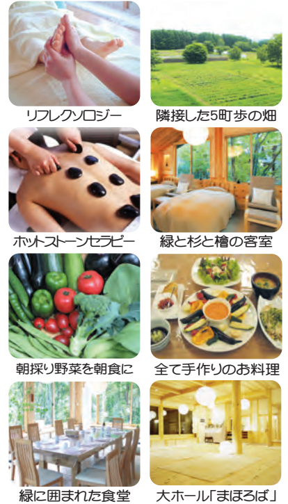
リフレクノロジー