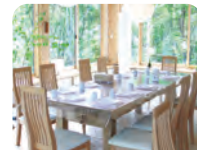
緑に囲まれた食堂