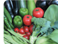
朝採り野菜を朝食に