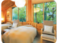
緑と杉と檜の客室