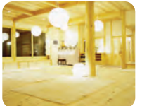
大ホール「まほろば」