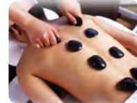
ホットストーンセラピー