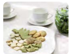
手作り野草クッキー