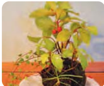
館内を彩るこけ玉