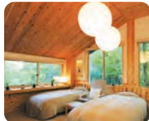
清潔第一のお部屋