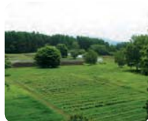
隣接する5町歩の畑