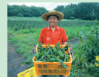
身体にいい野菜だぞー