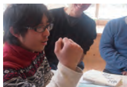
よつじゃ、がんばるぞ