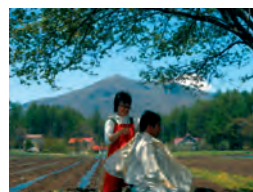
散髪もきもちいい

■車 長野市内から戸隠バードラインで大座法師池まで約25分。いびなりロードラインに右折、スキー場方面に。ホテル・アルカディア前を右折、約1分。