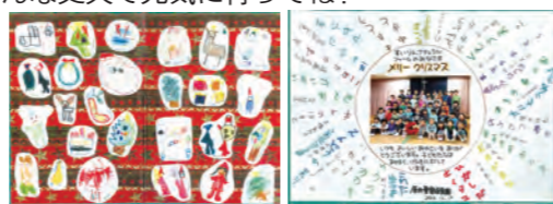
福島県の原町保育園の皆からのお手紙